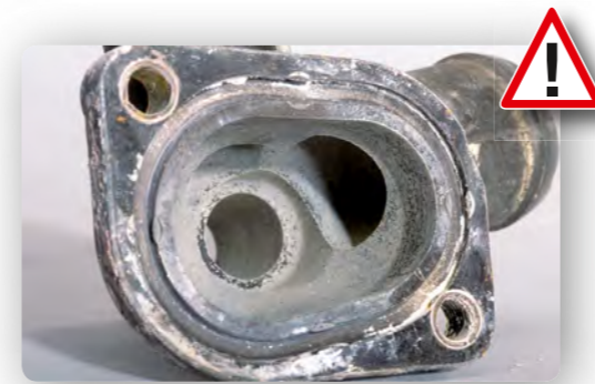
被水垢覆盖的管路